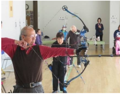
アーチェリー大会