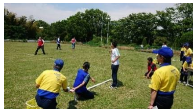
フライングディスク大会

この大会は茨木の全国大会の選手選考大会でもあり、熱い戦いが繰り広げられました。選手にも声をかけましたが、皆元気に、明るく泳いでくれたのが印象に残りました。(SY)